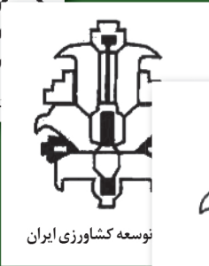
توسعه کشاورزی ایران